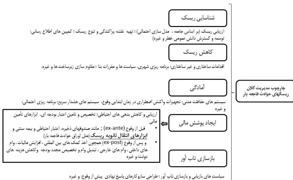
شکل ۱. چارچوب مدیریت کلان ریسک حوادث فاجعه‌بار

فعالان صنعت بیمه، تمایلی به مشارکت سرمایه‌گذاران در سود حاصل از مدیریت ریسک‌های بیمه‌ای نداشتند و از بازار سرمایه برای تأمین مالی استفاده می‌نمودند؛ اما کثرت، شدت و وسعت حوادث فاجعه‌بار در دهه‌های اخیر باعث شد که شرکت‌های بیمه، در پی یافتن منابعی باشند تا سرمایه لازم برای مواجهه با خسارت‌های ناشی از این‌گونه حوادث فاجعه‌بار را تأمین کند و تا زمانی که این سرمایه تأمین نشود، تمایلی به ارائه این‌گونه پوشش‌ها برای ریسک‌های حوادث فاجعه‌بار را ندارند. ارتباط بین صنعت بیمه و بازار سرمایه برای استفاده از منابع مالی، به‌منظور ایجاد ظرفیت قبولی بیشتر ریسک ذیل مفهوم آرت پایه‌ریزی شده است که به‌معنای استفاده از ابزارهای مدیریت ریسک (به‌غیر از بیمه و بیمه اتکایی سنتی) برای پوشش‌دهی به ریسک با راه‌حل‌های نوآورانه بیمه‌ای و راه‌کارهای بازار سرمایه به شرکت‌هایی است که در معرض آن ریسک‌ها قرار دارند. بانک جهانی استفاده از ابزارهای مالی انتقال ریسک جایگزین را به‌عنوان ابزارهای تأمین مالی قبل از وقوع ۱ رخدادهای فاجعه‌بار پیشنهاد داده است که هدف آن، ایجاد پوشش مالی در چارچوب مدیریت کلان ریسک‌های حوادث فاجعه‌بار است.