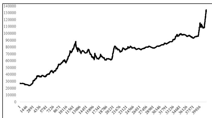
شکل ۱. سری زمانی داده‌های شاخص بورس اوراق بهادار تهران (۱۳۹۱ تا ۱۳۹۷)

* رد وجود ریشه واحد در سطح معناداری ۱ درصد ** مانایی سری‌های بازده در سطح معناداری ۱ درصد